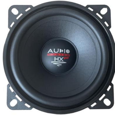
EX 100 SQ EV03